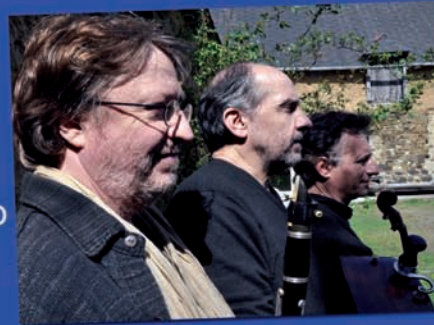
Le swing du pays Gallo Bal Gallo Trio